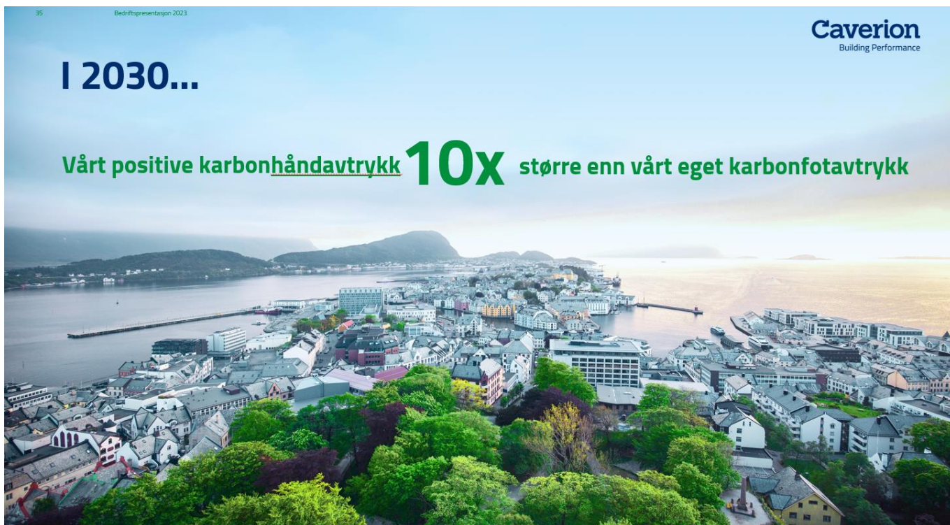
Fig. 5: Strategisk mål håndavtrykk/fotavtrykk.