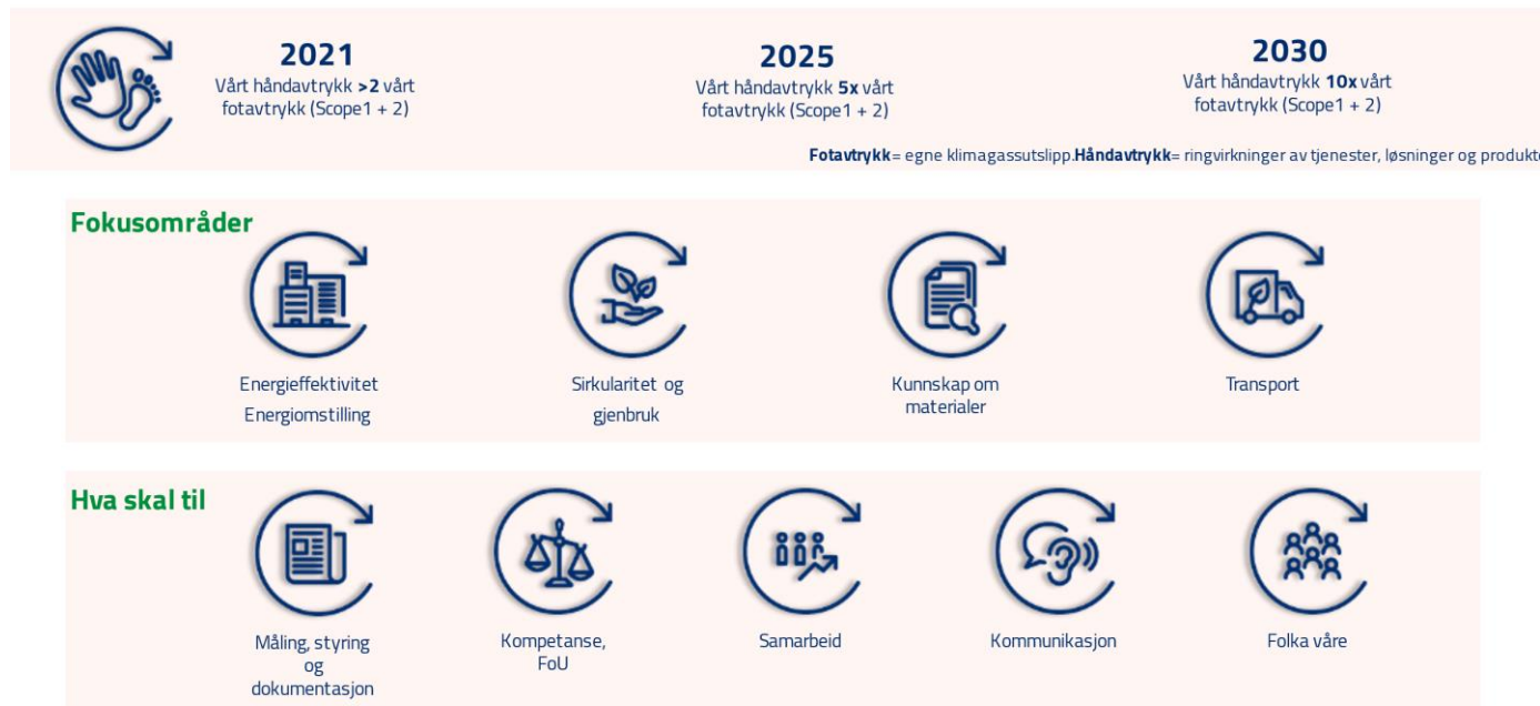
Fig. 3: Caverion og det grønne skiftet

Fig. 3 viser et Klimaveikart for Caverion Norge.