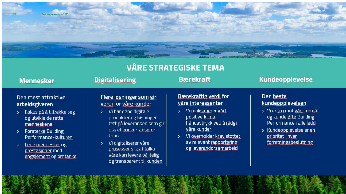
Fig. 2: Strategiske tema