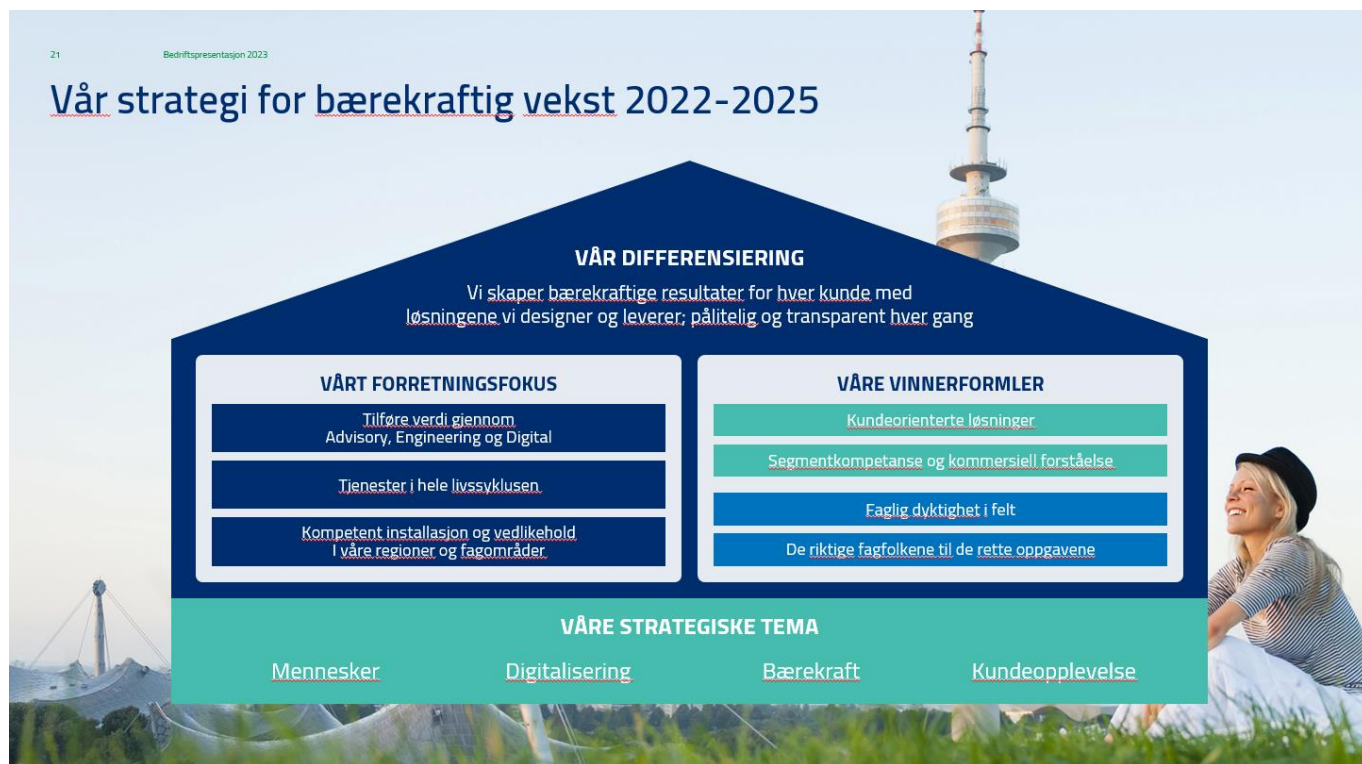
Fig. 1: Caverionkonsernets strategi for bærekraftig vekst 2022-2025

Vi har som mål at vårt positive karbonhåndavtrykk skal være 5 ganger større enn vårt karbonfotavtrykk (Scope 1-2) innen 2025 og 10 ganger større innen 2030. Klimamålene blir nådd blant annet ved å forbedre vår egen og våre kunders energieffektivitet, ved økt bruken av fornybar energi i bygget miljø og ved å administrere tjeneste- og forsyningskjeder ansvarlig. For hvert av disse fokusområdene har vi satt konserndekkende KPIer og handlingsplaner.